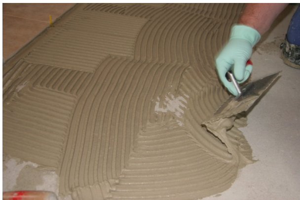
Schritt 1: Fliesenkleber auf Untergrund auftragen