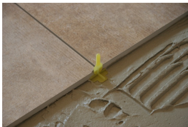
Schritt 4: Einbringen der Gewindelaschen