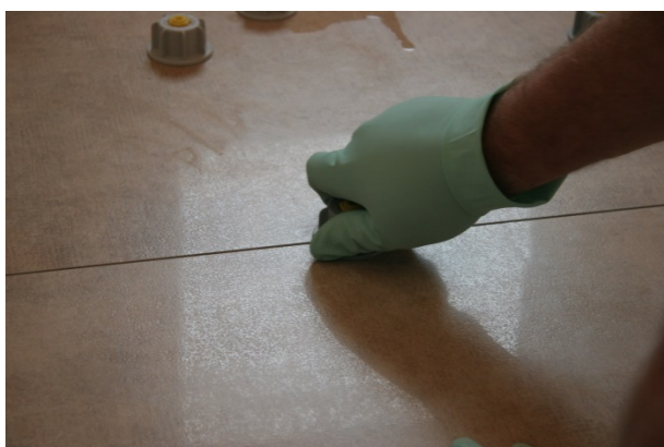
Schritt 5: Zughaube auf Gewindelasche schrauben um die Fliese auf das gewünschte Niveau anzuheben